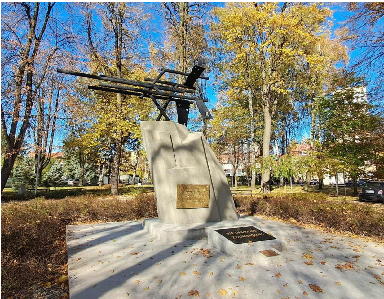
Pomnik ku czci poległych w walce z faszyzmem – Park Miejski przy ul. Kościuszki w Brzeszczach