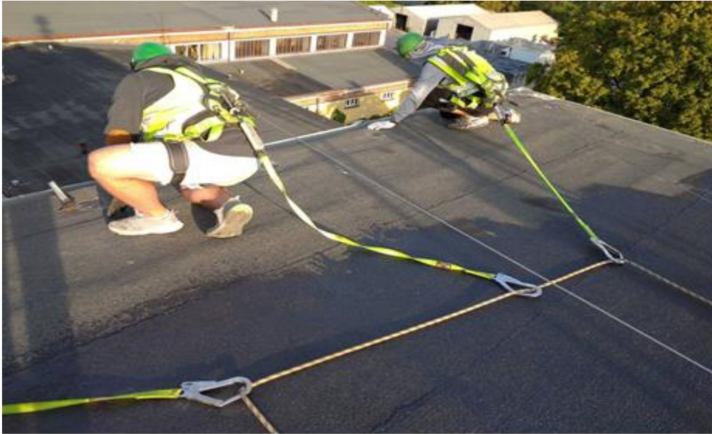
Remont dachu na zabytkowym szybie Andrzej III, na terenie KWK Brzeszcze Wschód