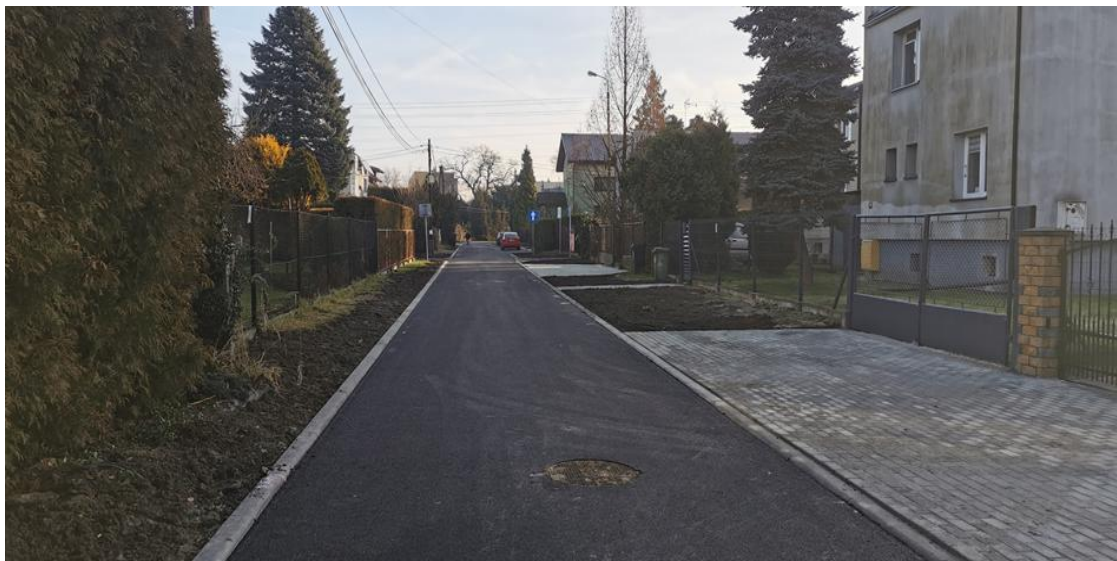
ul. Kopernika po remoncie