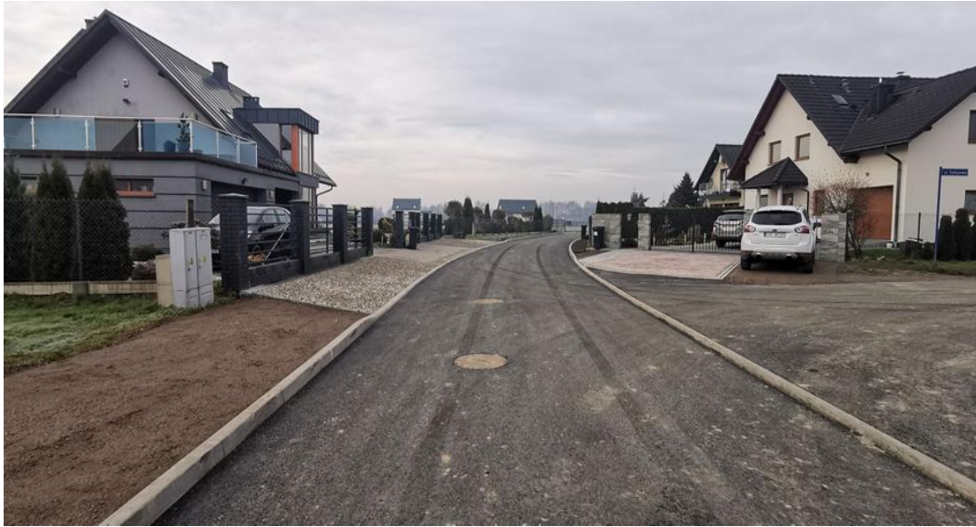
ul. Biała wewnętrzna – po remoncie