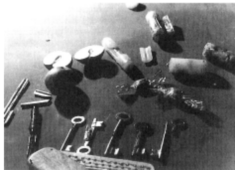
Przedmioty, w których przenoszono grypsy.