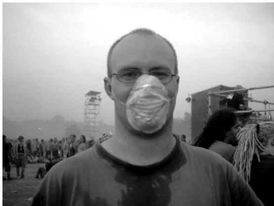
Maska chroniąca przed pyłem to niezbędne wyposażenie woodstockowiczów bawiących się tuż pod sceną.

Program tegorocznego Woodstocku był tak nietuzinkowy, że naprawdę było w czym wybierać. Nie zawiedli się ci, którzy przyjechali nie tylko posłuchać muzyki i się pobawić, ale również przeżyć coś głębokiego, poszerzyć swoje horyzonty intelektualne, porozmawiać na trudne tematy. Na stronie internetowej festiwalu czytamy: „Mamy świadomość, że nie jest to tylko i wyłącznie wydarzenie artystyczne, festiwal rockowy, ale że na trwałych fundamentach rock'n'rolla powstaje tam niezwykle wartości-