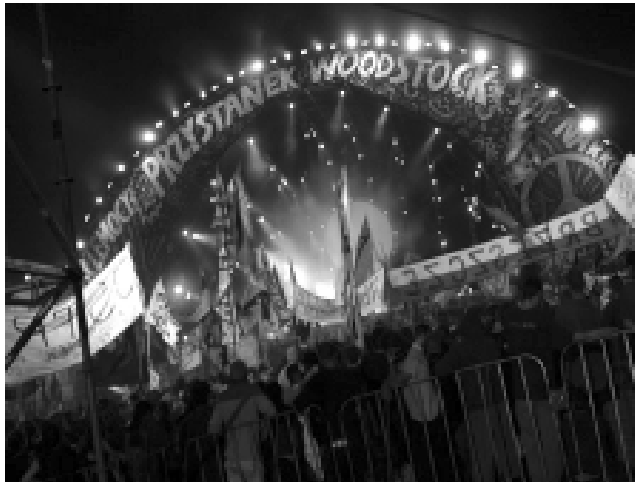
Na Przystanku Woodstock powiewała też flaga z napisem Brzeszcze (po prawej stronie zdjęcia).

Przyjaźń! Muzyka! Stop przemocy! Stop narkotykom!” nie są pusto brzmiącymi słowami. Kto był i czuł tę więź z innymi, zauważył, że ignorancji trzeba by tam szukać z lupą w rękę. Festiwalowe spotkania zbliżyły ludzi do siebie, a dzięki takiemu obcowaniu z innymi stali się bardziej wrażliwi na drugiego, a muzyka to tylko umocniła.