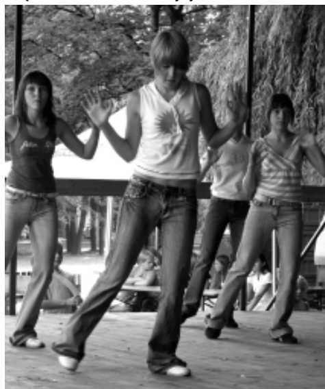
Grupa taneczna ze świetlicy OK na os. Paderewskiego.

Impreza rozpoczęła się występem mażorettek „Szalone małolaty”, po którym zespół kabaretowy „Tęcza” bawił publiczność piosenkami „Panna Andzia”, „Frajarka”, „Kawaler” i „Grające trąbki”. Największe oklaski zebrały jednak