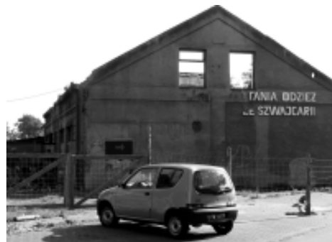
Otwarcie odremontowanej „Bergerówki” przewidziano na listopad.

Społem PSS „Górnik” zakupi nowe urządzenia chłodnicze na nowo powstałe stoisko mięsno-wę-