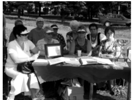
Amazonki mówią, że za rok znowu powalczą o pierwsze miejsce.

Organizator spartakiady - Federacja Amazonek w Poznaniu - zafundował wszystkim uczestnikom