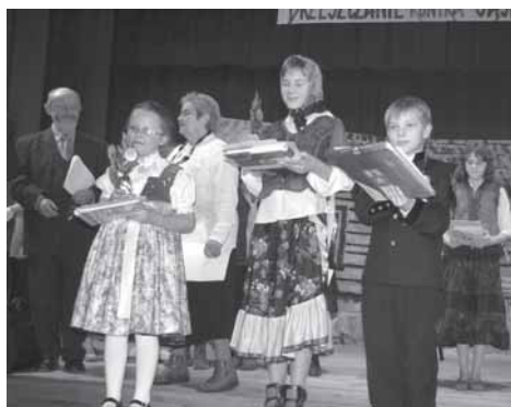
Najlepsi gawędziarze wśród dzieci.

wie, Miedźnej i Górze. Na naszym terenie jest 250 ha stawów rybnych, 900 ha Puszczy Pszczyńskiej, unikalne zakątki flory i fauny i ścieżki spacerowe. Możemy poszczycić się świetną bazą edukacyjną. W ostatnich latach powstały nowe liceum i gimnazjum, mamy w gminie dwie szkoły średnie, któ-