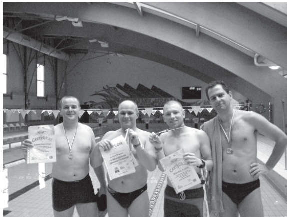
Laureaci akcji „Pływanie na medal”

W Mikołajkowych Zawodach Pływackich wzięło udział ponad 150 osób - uczniów szkół podstawowych, gimnazjów a także przedszkolaków (wyniki obok w ramce).