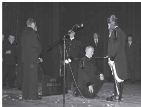
Uczniowie PZ nr 6 wzięli udział w ceremoniale pasowania na górnika.

Powiatowy Zespół nr 6 Szkół Zawodowych i Ogólnokształcących w Brzeszczach od 2005 r. kształci techników górników o specjalności tech-