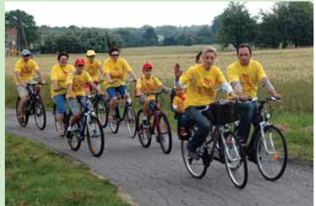
Jak co roku pod koniec czerwca odbyły się Dni Gminy Brzeszcze. Już po raz szósty mieszkańcy gminy Brzeszcze przejechali trasą Rodzinnego Rajdu Rowerowego.