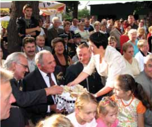
We wrześniu dożynki gminne nie bez powodu odbyły się w Brzeszczach. Miasto w 2007 r. obchodziło 45. rocznicę nadania praw miejskich.