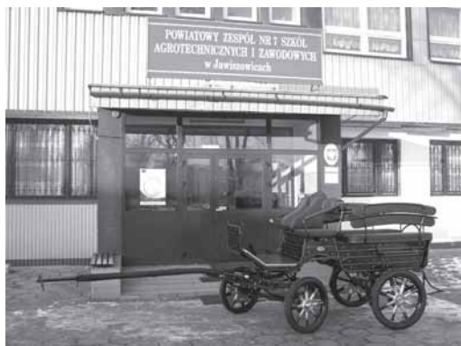
Nowa bryczka będzie służyła uczniom do nauki powożenia.

W bieżącym roku szkolnym dyrekcja szkoły za cel postawiła sobie doposażenie bazy dydaktycznej warsztatów szkolnych i pracowni gastronomicznej w takim stopniu, by absolwentów