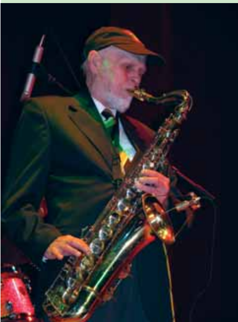
W październiku na scenie Ośrodka Kultury ze swoim Kwartetem wystąpił jeden z najwybitniejszych polskich jazzmanów Jan Ptaszyn Wróblewski.