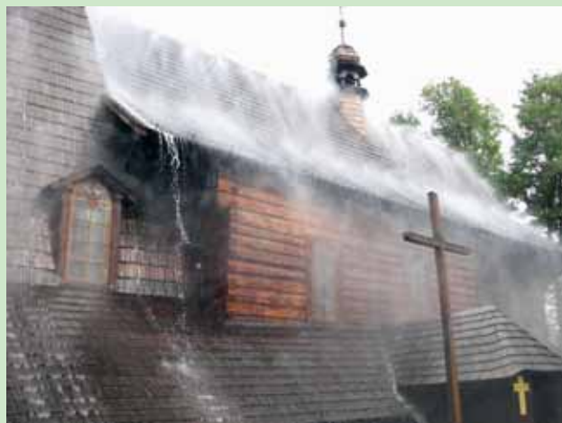
W październiku w kościele św. Marcina w Jawiszowicach zainstalowano samoczynnie działającą instalację gaśniczą. Tym samym jawiszowicki kościół znalazł się wśród 15 najcenniejszych obiektów w Małopolsce, które otrzymały najbardziej nowoczesny system zabezpieczenia.