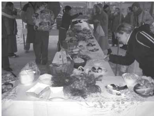
Smaczne wigilijne potrawy przygotowali uczniowie PZ nr 7 SzAiZ z Jawiszowic.