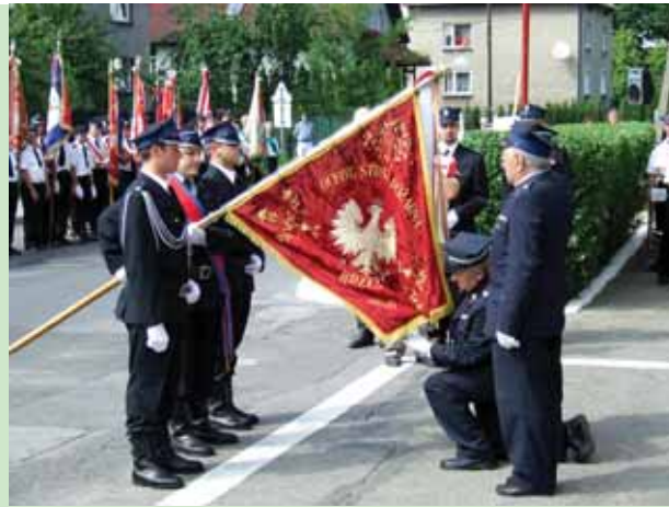
9 czerwca Ochotnicza Straż Pożarna w Brzeszczach obchodziła jubileusz 120-lecia działalności.