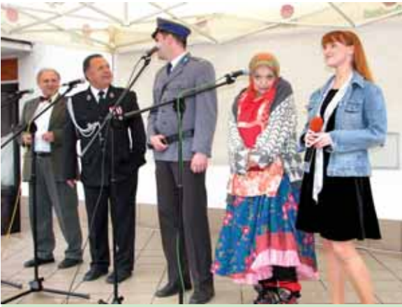
W maju jawiszowicka Ochotnicza Straż Pożarna świętowała jubileusz 85-lecia, a 15. rocznicę strażacka orkiestra dęta. O jubileuszu jawiszowickich strażaków pamiętał komendant Wojtuś (Leszek Benke) z Kopydłowa.