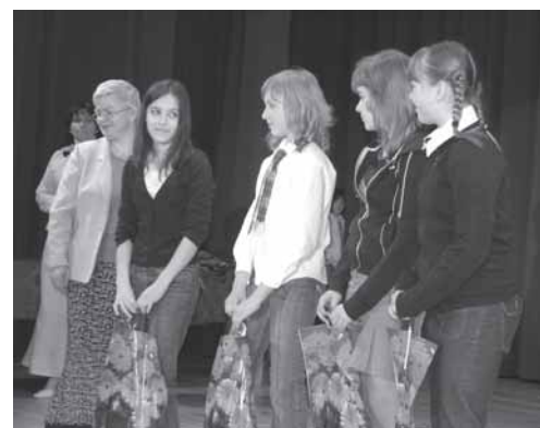
Wśród nagrodzonych nie brakowało uczniów brzeszczańskich szkół.

Wszyscy finaliści otrzymali pamiątkowe dyplomy i upominki, a laureaci cenne nagrody rzeczowe, których za-