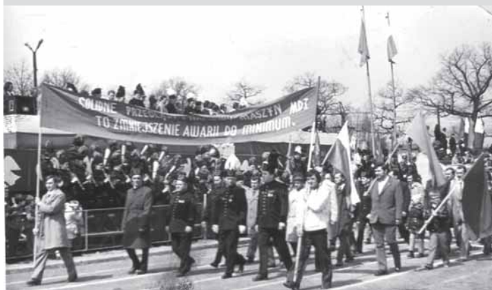
Pochody pierwszomajowe zawsze kończyły się na stadionie KS Górnik, gdzie na mieszkańców czekali partyjni oficjele.

W pogodnym i radosnym nastroju przy dźwiękach orkiestry kopalni „Brzeszcze” pochod 1-majowy wyrusza na stadion, gdzie przed trybuną honorową przededefilowali wszyscy uczestnicy pochodu.