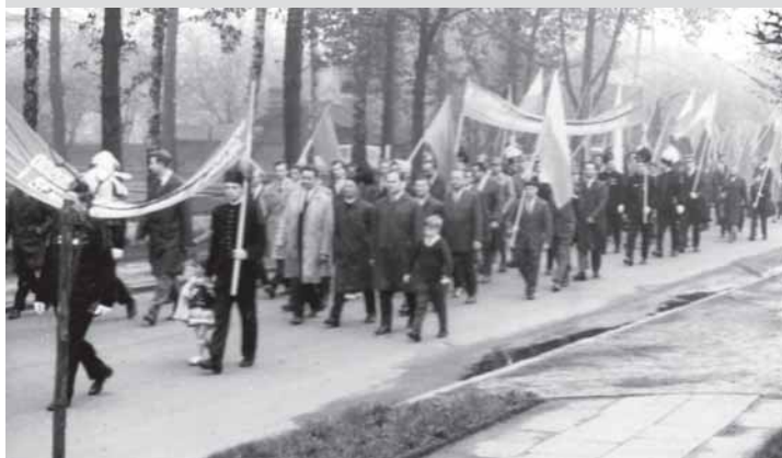
Nieodłącznym elementem pochόδów oprócz flag państwowych były sztandary z hasłami propagandowymi.