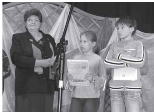
Laureaci konkursu nagrody odebrali 19 kwietnia w Ośrodku Kultury.

Na dużym stoisku postawionym wzdłuż kościelnego ogrodzenia wybór ozdób i prezentów wiel-