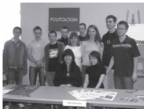
Studenci politologii PWSZ w Oświęcimiu.

- Władze uczelni bardzo wysoko oceniły organizację Dni Otwartych, przede wszystkim zaangażowanie kół naukowych działających w PWSZ - koła naukowego politologów i rosjoznawców, a także