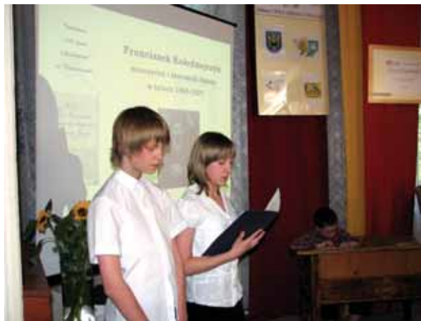
Podczas wystawy w „Brzoście” uczniowie przypomnieli sylwetki nauczycieli Jedyнки z lat międzywojennych.

16 kwietnia odbyła się pierwsza z cyklu zaplanowanych imprez, przebiegająca pod ha-