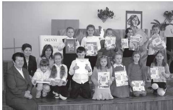
Konkursy recytatorskie cieszą się wśród dzieci dużym powodzeniem.

Uczestnicy konkursu otrzymali pamiątkowe dyplomy uczestnictwa w konkursie oraz nagrody książkowe ufundowane przez Gminny Zarząd Edukacji, Ośrodek