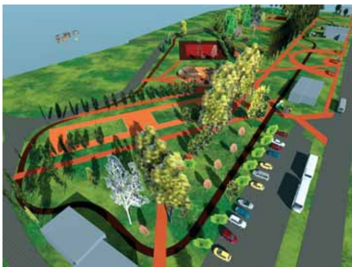
Amfiteatr, korty tenisowe, skatepark, ścieżki rowerowe. Nie wiemy kiedy te śmiałe wizje się ziszczą.

Nie ma szczęścia park miejski przy ul. Dworcowej. Jego przebudowa zapowiadana jest od kilku lat, ale jak dotąd na zapowiedziach się kończy. Mieszkańcy Brzeszcz nadal pozostają bez atrakcyjnego i bezpiecznego miejsca do rekreacji i wypoczynku.