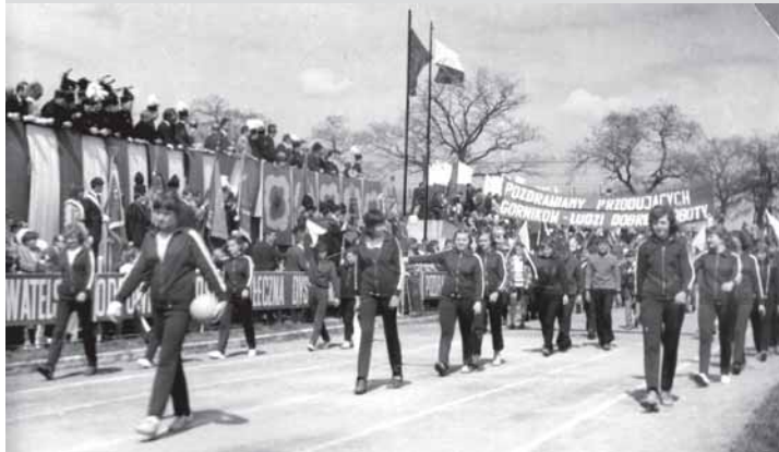
Sportowcy KS Górnik Brzeszcze w pochodzie pierwszomajowym.