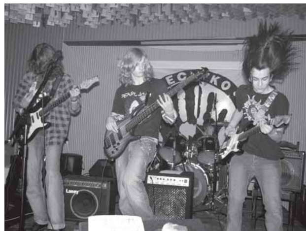
Wieczorem w klubie „Babel” zagrały młode kapele z Brzecz.

- Dziękujemy wszystkim, którzy w jakikolwiek sposób przyczynili się do organizacji XVI Finału WOŚP w Brzesczach: nauczycielom za opiekę nad wolontariuszami i sprzedaż ciast, Straży Miejskiej, Policji, Ochotniczej Straży Pożarnej z Jawiszowic, Bankowi Spółdzielczemu w Miedznej oddział w Brzesczach, Lokalnemu Informatorowi Telewizyjnemu „Obiektyw”, filmującemu orkiestrowe poczynania od samego rana do późnych godzin wieczornych oraz wspinałym wolontariuszom