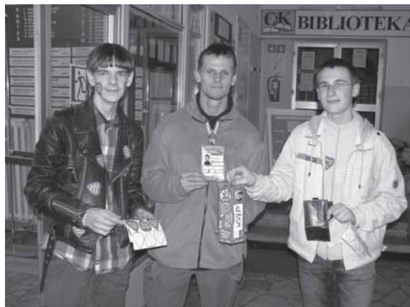
Wolontariusze nie musieli specjalnie zachęcać brzeszczan do zapewnienia puszek.

Od wczesnego niedzielnego ranka - 13 stycznia - 130 wolontariuszy ze szkół podstawowych i gimnazjalnych pod patronatem Młodzieżowego Parlamentu Gminy Brzescze przystąpiło do kwesty. Ich zapał zaowocował zebraniem ponad 22 tys. zł.