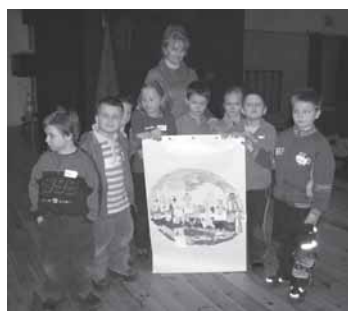
Przedszkolaki z „Żyrafy” prezentują swoją pracę.

Zajęcia plastyczne przeplatane były integracyjnymi zabawami z chustą i tunelem, żywiołowymi