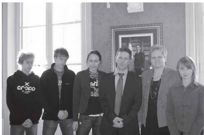
Grupa z G1 na spotkaniu z merem Saint Chamas we Francji.

29 listopada odbyła się dyskoteka andrzejkowa, połączona z koncertem zespołu Filt. Chociaż w naszej szkole są uczniowie o różnych upodobaniach muzycznych, to jednak każdy mógł się dobrze bawić przy ulubionym rodzaju muzyki, ale