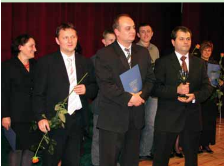
Stowarzyszeniu „Obiektyw” przyznano Oskarda - nagrodę specjalną.