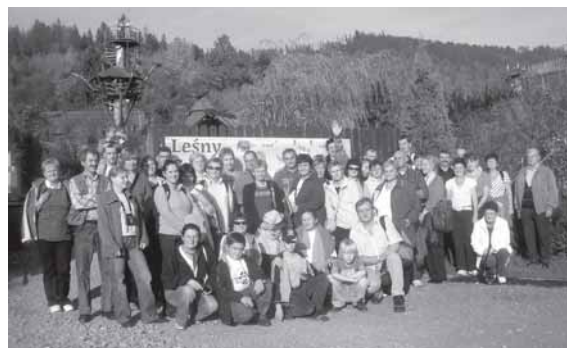
Przed wejściem do Leśnego Grodu w Milówce.

11 października wycieczkowicze - nim dotarli do Żywca - po drodze zahaczyli o Porąbkę, gdzie zwiedzili elektrownię szczytowo-pompową Porąbka-Żar. W Żywcu zaś, w towa-