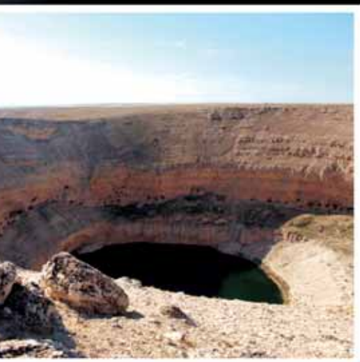
powulkaniczny lej CIRALI