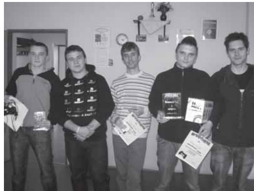
Zwycięzcy i Mistrzostw Brzeszcz w Pro Evolution Soccer.

Areną zmagania była siedziba Samorządu Osiedlowego nr 1 przy ul. Mickiewicza. Do dyspozycji zawodników oddano cztery, świetnie przygotowane stanowiska. Na starcie zameldowało się 20 uczestników, którzy po losowaniu zostali podzieleni na cztery grupy. Wraz z pierwszym gwizdkiem wirtualnego sędziego na boisku i na sali rozpoczęły się prawdziwe emocje. Rozgrywki grupowe wyłoniły najlepszą ósemkę, która w systemie pucharowym walczyła o awans do finału. Po wielu, długich godzinach zmagania, na placu boju zostały już tylko dwie niepokonane osoby. W