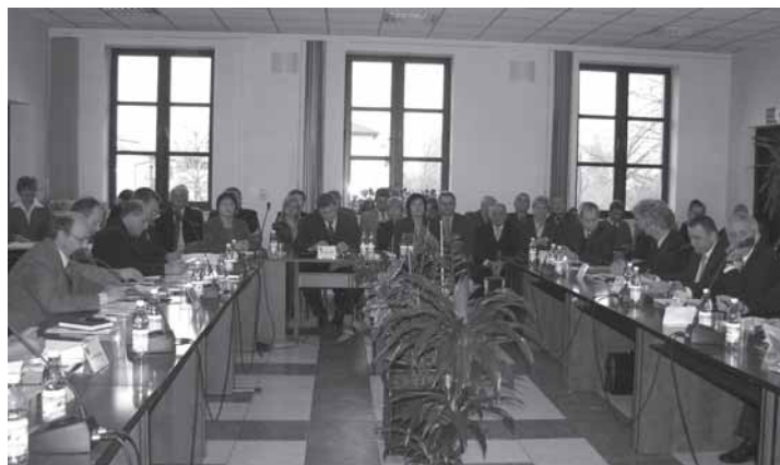
Inauguracyjna sesja Rady Miejskiej w Brzeszczach. Listopad 2006 r.

rów, ul. św. Wojciecha, ul. Olszenik, ul. Bór, ul. Topolowa, oświetlenie ul. Kolonia w Wilczkowicach) oraz projekty techniczne ulic: Reja, Stefczyka, Kościelnej, drogi łączącej ul. Sobieskiego z ul. Dąbrowskiego,