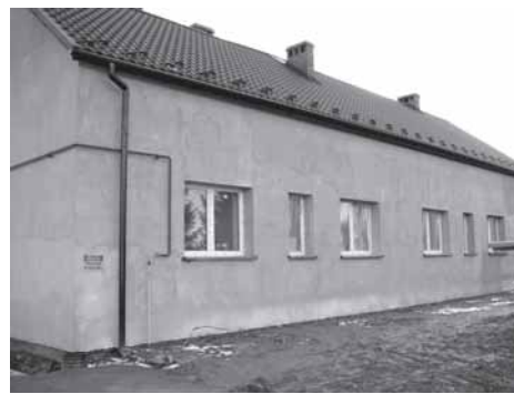
Do nowych mieszkań lokatorzy wprowadzą się nie wcześniej niż pod koniec listopada.

Końcowy odbiór mieszkań komunalnych w Zasolu odbył się 8 października. Powierzchnia każdego z nich jest inna i wynosi odpowied-