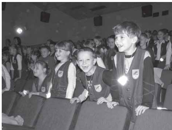
Pierwszoklasiści jak zawsze bawili się znakomicie.

Program edukacyjny o bezpieczeństwie dla uczniów klas pierwszych szkół podstawowych organizuje Straż Miejska