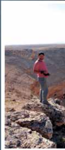
Turcja - olbrzymi