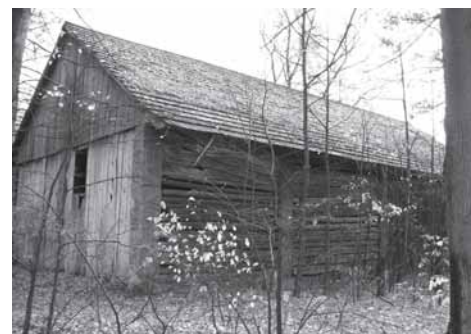
Stodoła na granicy Jawiszowic i Dankowic (tzw. „sabudówka” od nazwiska Sabuda), w której ukrywali się partyzanci z oddziału „Sosienki”.

Rodzina musiała być bardzo czujna. We wsi nie brakowało konfidentów, którzy bez wahania informowali Niemców o podejrzanych sprawach.