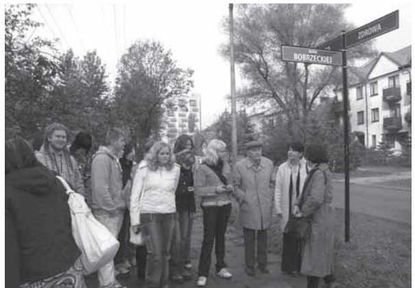
Spacer ulicą Marii Bobrzeckiej w Krakowie.