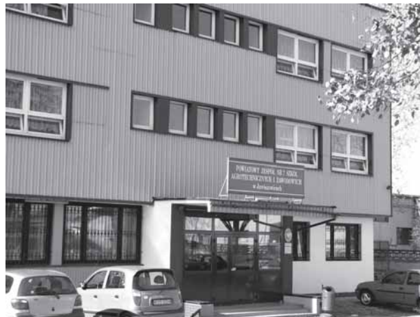
Nie ma mowy o likwidacji szkoły! - zapewnia dyrektorka PZ nr 7 w Jawiszowicach.

Zarząd Powiatu Oświęcimskiego zamówił opracowanie „Strategii rozwoju oświaty w powiecie oświęcimskim w latach 2008-2013”. Dokument, za który Starostwo Powiatowe zapłaciło 20 tys. zł, przygotował Instytut Badań w Oświęcimiu z Sopotu. Tezy w nim zawarte okazały się bardzo kontrowersyjne. Autor projek-