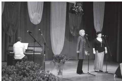
Dla pracowników oświaty śpiewał zespół „Wariant M”.