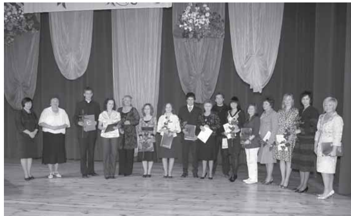
Młodzi nauczyciele odebrali akty nadania stopnia nauczyciela kontraktowego.