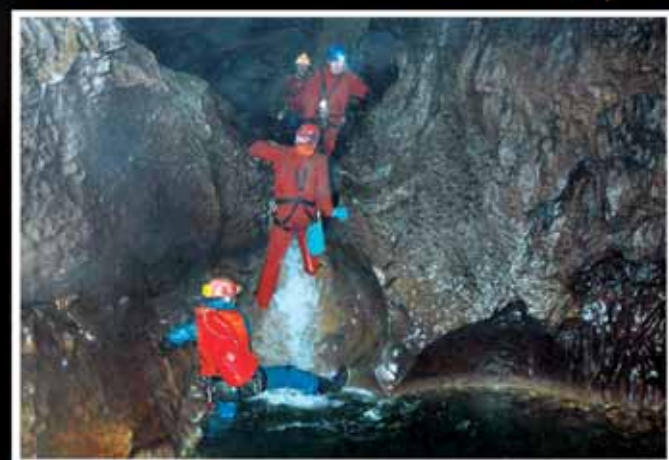
Meksyk - podziemna rzeka - jaskinia Cueva Lavinata.