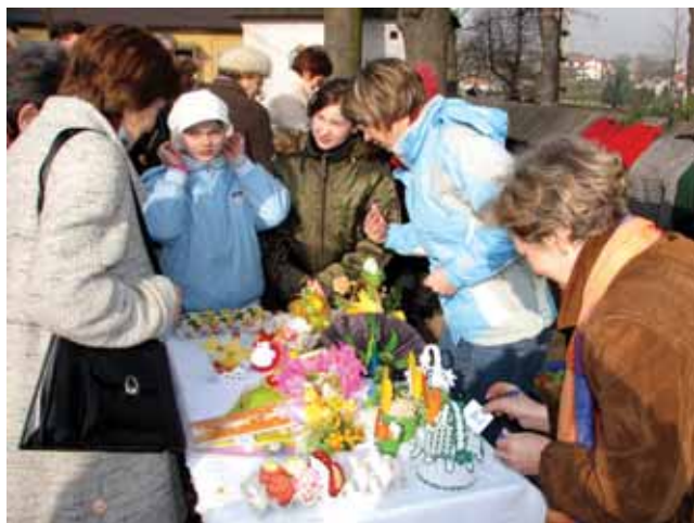
Jawiszowianie mogli przebierać w świątecznych ozdobach.

16 marca chętni mogli nabyć opatrzone pieczęcią okolicznościowe kartki z widokami dawnych i obecnych Jawiszowic - budynkami Szkoły Podstawowej i dawnej karczmy w Kółku, kościoła św. Marcina i najstarszej części wsi - Nawisia.