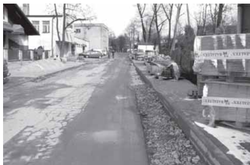
Od września ub. roku przejazd ul. Handlową jest utrudniony.

Wykonawcy robót, którym jest konsorcjum firm: Przedsiębiorstwo Usługowo-Handlowe „Rezbud” z Ja-