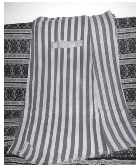
Worek na żywność uszyty z obozowej sukienki.

- Prace, które otrzymaliśmy w tym roku są dowodem na to, że wszyscy co pewien czas potrzebujemy zagłębić się w historię, aby zro-