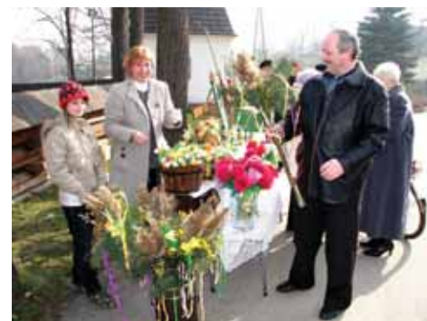
Kto nie zdążył wykonać świątecznej palmy, nie odszedł od straganu z pustymi rękami.