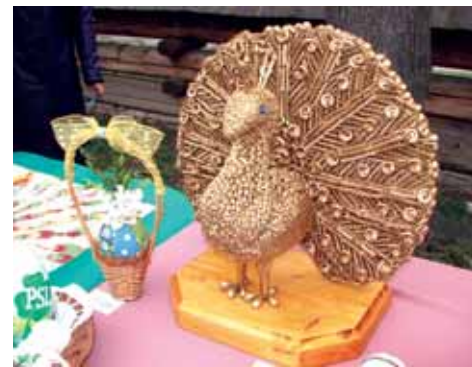
Jawiszowickie pawie jak zwykle wykonano starannie i oryginalnie.

W konkursie na „Jajuszowickie Jajo” - w kategorii dzieci i młodzież - pierwsze miejsce