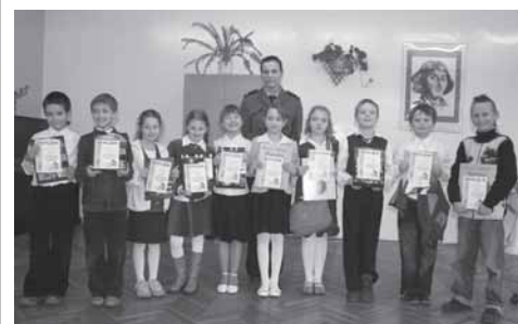
Laureaci konkursu wiedzy o bezpieczeństwie w ruchu drogowym.