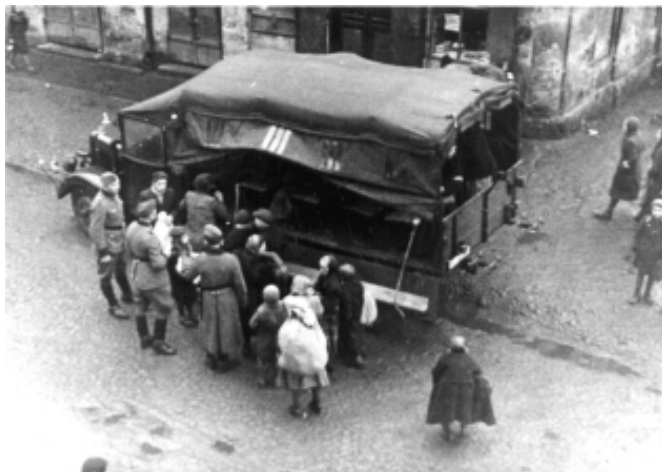
Wysiedlenie mieszkańców Oświęcimia.

Władze obozu robiły wszystko, by nie dopuścić do kontaktów mieszkańców okolicznych wsi z więźniami KL Auschwitz i odizolować obóz od świata zewnętrznego. Na wysiedlonym terenie utworzono tzw. Interessengebiet des Konzentrationslager Auschwitz, czyli „obszar interesów obozu koncentracyjnego Auschwitz”. Obszar ten, o powierzchni około 40 m 2 , położony był w rozwi-