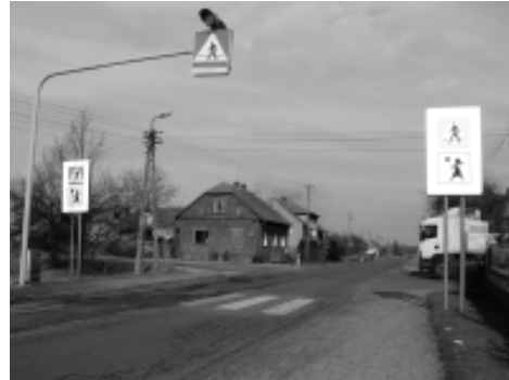
Przez skrzyżowanie w Zasolu przejeżdża ok. 3950 pojazdów na dobę.

Z wnioskiem o przebudowę skrzyżowania do ZDW zwrócili się mieszkańcy i Rada Sołecka Zasola. W tej sprawie interweniowała też poseł Beata