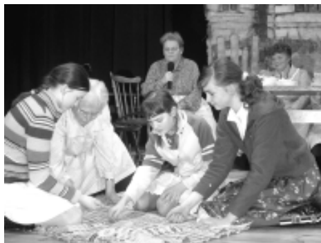
Brzeszczanki grały w „kamyki”.

Uczniowie klas piątych, zespoły regionalne oraz nauczyciele przedstawili tradycyjne zabawy i popularne gry w swoich środowiskach. Młodzież przygotowała opis graficzny i ilustracje do każdej z zabaw. Tradycyjne zabawy prezentowane przez zespoły regionalne i dzieci odbiegały nieco od dzisiejszych form spędzania wolnego czasu preferowanych przez dzieci, ale momentami zabawa była przednia. Jak choćby w przypadku zabawy w „dupki” przedstawionej przez Paświszczan i dzieci z Zasola. Nazwy innych gier i zabaw brzmiały równie zaskakująco: „horpor”, „rafka”, „sнопki”, „gdzie jest moja złota kula”, „moja ulijanko”. Część z nich została już zapomniana, ale do