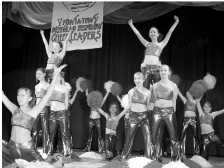
Zespół „Gracja” zrobił na jurorach największe wrażenie.