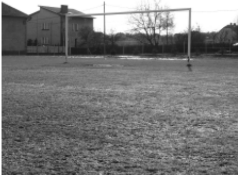
Boisko w Przecieszynie nie nadaje się do gry.

Boisko w Przecieszynie jest w fatalnym stanie. Jeszcze niedawno zalane było wodą. Teraz woda już zeszała, ale o grze w piłkę nie ma mowy. 9 kwietnia w drugiej kolejce B-klasy LKS Przecieszyna ma podejmować u siebie Głębowice.