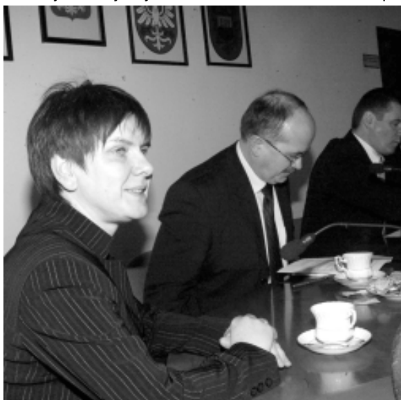
Beata Szydło: – Koalicja z Platformą nie wchodzi w grę.

Jeśli wniosek o samorozwiązanie Sejmu przepadnie, to będzie budowana koalicja rządowa. Jeszcze za wcześniej mówić w jakim kształcie i z kim. Jedno jest pewne, to będzie koalicja budowana z perspektywą do końca obecnej kadencji Sejmu.