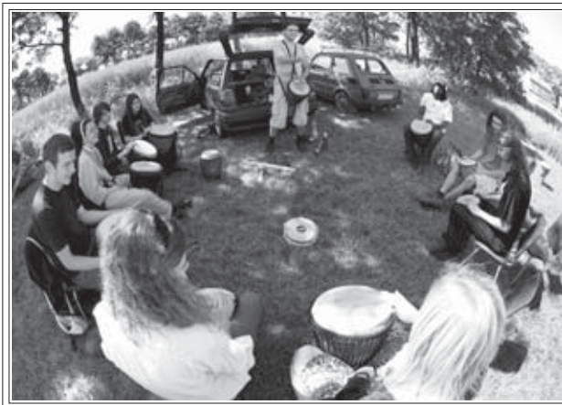
Pocuj Ducha Afryki - warsztaty bębniarskie