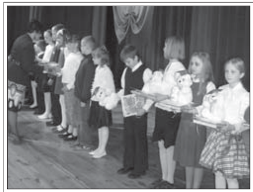
Najlepsi z najlepszych odbierali nagrody

W dniu jubileuszu wręczono również nagrody