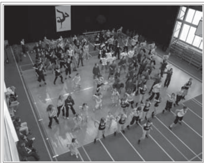
Podczas przerwy wszyscy uczestnicy razem zatańczyli