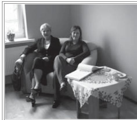
Centrum to miejsce, gdzie można przyjść i porozmawiać