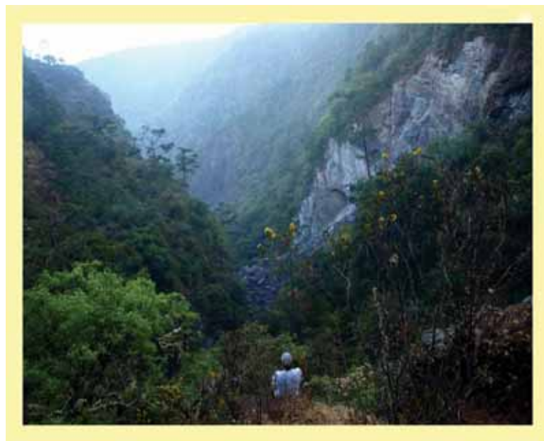
Dziewicze tereny łańcucha górskiego Sierra Madre del Sur