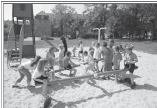
W czasie wakacji zwracamy baczną uwagę na nasze pociechy