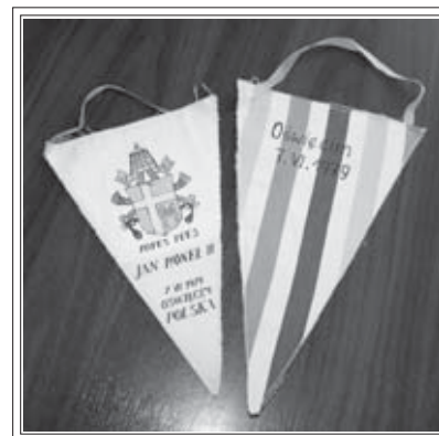
Proporzeczki uczestników pielgrzymki - Brzezinka '79

Na tę uroczystość przybyło bardzo dużo osób, zarówno miesza-