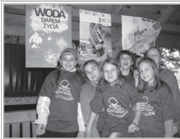
Uczestnikom zlotu mimo deszczowej aury humory dopisywały

Ale na zlocie, jak zawsze, nie zabrakło smacznych kielbasek, które na grillu przyrządzali uczniowie Technikum Żywności w PZ nr 7 Szkół Agrotechnicznych i Zawodowych w Jawiszowicach. Były ciepłe i zimne napoje, i wielosmakowe