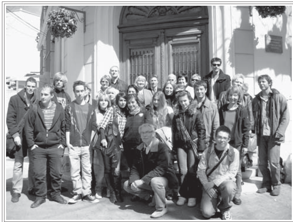
Uczestnicy projektu z Francji, Niemiec i Polski przed Merostwem w Saint Chamas - marzec 2009 r.