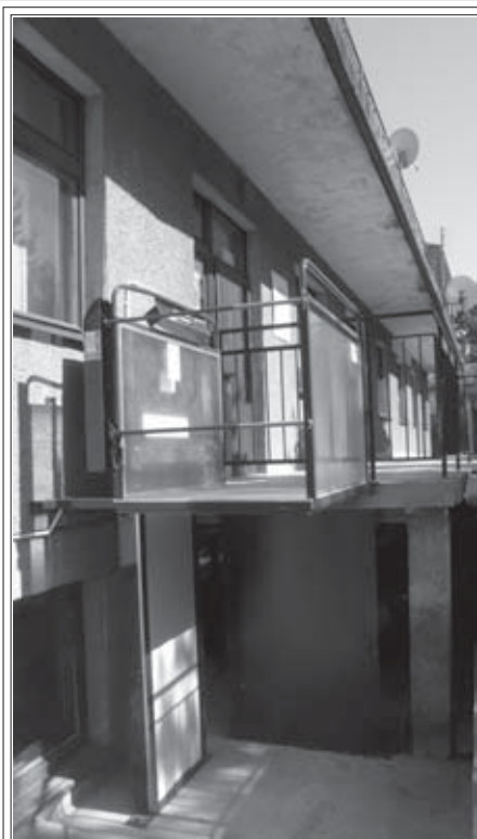
W przychodni w Zasolu działa już winda dla niepełnosprawnych