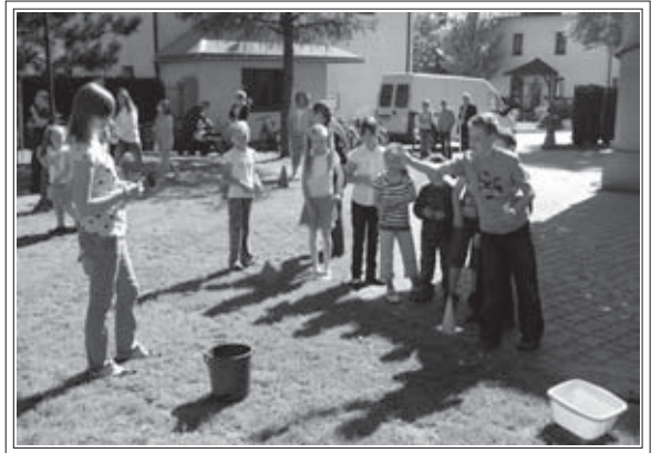
Podczas majówki odbyły się konkursy z nagrodami dla dzieci