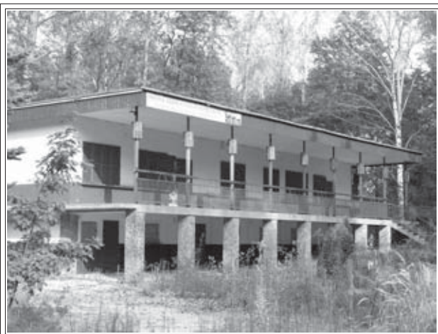
By ośrodkowi w Skidzinie przywrócić blask, działacze LKS Skidziń zadeklarowali właścicielowi - spółce „JAPI” współpracę

Spółka „JAPI” z Łomży, która we wrześniu ub. roku w drodze przetargu od gminy Brzeszcze kupiła nieruchomość w Skidzinie nad Sołą obiecała ożywić teren byłego ośrodka rekreacyjnego. Minęło osiem miesięcy, a tam czas zatrzymał się w miejscu. W sukurs spółce podążają działacze LKS Skidziń.