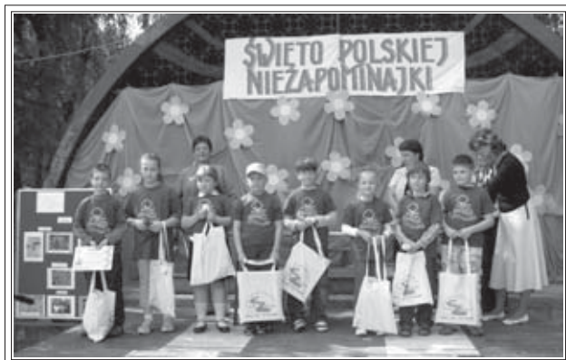
Stowarzyszenie „Bios” nagrodziło dzieci biorące udział w konkursie

Prężnie działające w Szkole Podstawowej nr 2 w Brzeszczach Szkolne Koło Przyjaciół Przyrody klas I-III już 5 lat temu zapoczątkowało w „Dwójce” niezapominajkowe obchody. Organizowano szkolne, niezapominajkowe apele i przedstawienia, warsztaty ekologiczne, konkursy plastyczno-techniczne, literackie i fotograficzne dla najmłodszego pokolenia brzeszczan. W tym roku postanowiono obchody przenieść na grunt gminny. W działania chętnie włączyły się firmy ogrodnicze i szkółkarze, liczne placówki oświatowe, Agencja Komunalna, Ośrodek Kultury, Klub Babskie Fanaberie działający przy Bibliotece „Strażnica”. Organizację zaś na swoje barki wzięło Stowarzyszenie „Bios”.