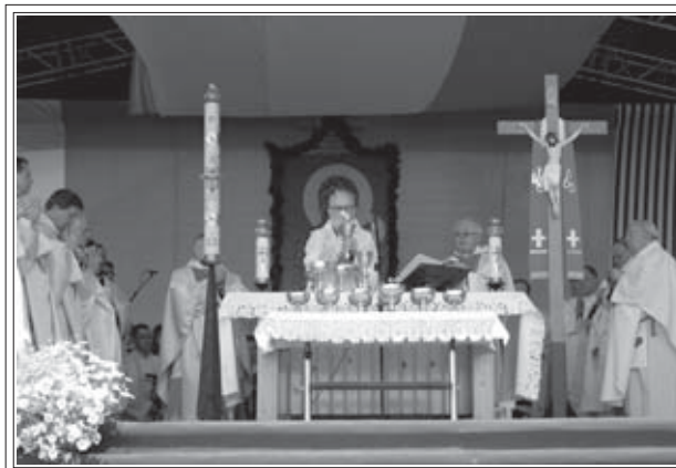
Kardynał Franciszek Macharski odprawiający mszę św. podczas obchodów 30. rocznicy pierwszej pielgrzymki Jana Pawła II do Ojczyzny