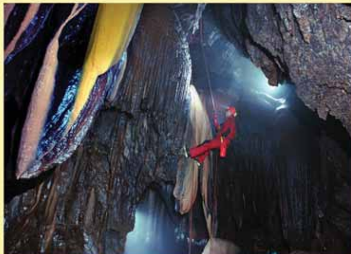
W jednej z eksplorowanych studni jaskiniowych

Nie tak od razu udało się grotolazom pojechać w góry. Musieli swoje odczekać zanim otrzymali stosowne pozwolenia. W krainie wiecznego maniana zawsze musi coś wyskoczyć. Tak więc zamiast do stanu Michoacan wyskoczyli do stanu Hidalgo na montaż tyrolki. To im nawet pasowało, gdyż obecnie zabawy linowe są w modzie i - jak mówią - dobrze być z tym na bieżąco. Wspólnie z meksykańskimi grotolazami zbudowali największą w Meksyku, a może nawet całej Ameryce, tyrolkę o długości 800 metrów i jako pierwsi ją wypróbowali.