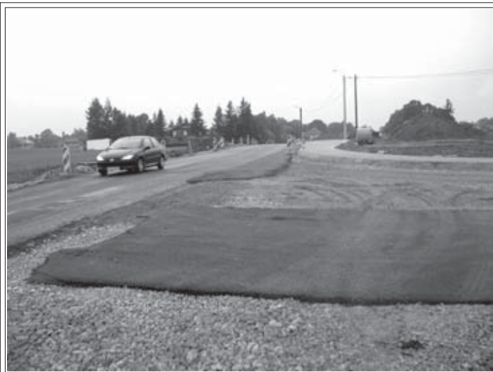
Kierowcy przejeżdżający przez remontowaną drogę muszą uzbroidź się w cierpliwość

Przebudowa Bielskiej, która rozpoczęła się w ubiegłym roku, ma się zakończyć w 2010 roku.