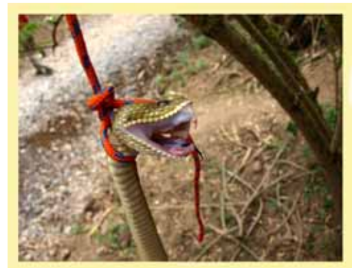
Schwytany przez grotolazów grzechotnik meksykański