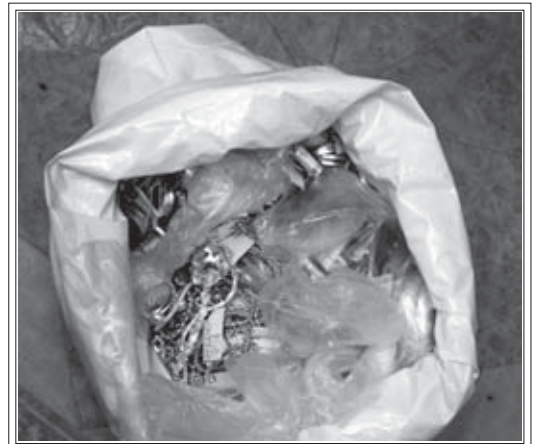
Biżuterię pochodzącą z kradzieży w Brzeszczach policjanci odnaleźli w mieszkaniu w Tychach