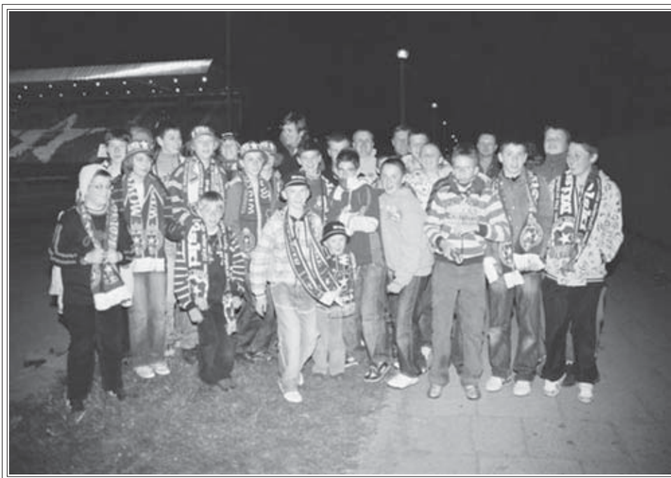
Uczestnicy wyjazdu do Krakowa przed stadionem Wisły Kraków